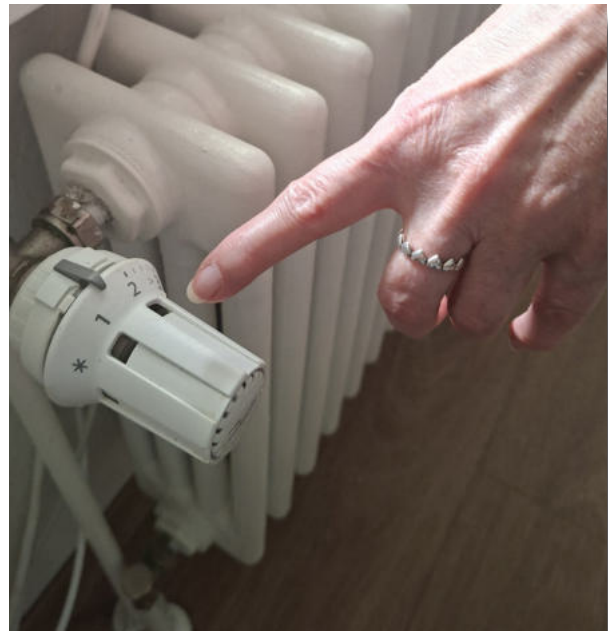
Heizungsthermostate wie dieser, sind im DRK-Kreisverband bald Geschichte.

Die präzise Steuerung und die einfache Handhabung soll dazu beitragen die Akzeptanz im Alltag zu erhöhen und nachhaltigeres Nutzungsverhalten in den Einrichtungen des DRK-Kreisverbandes Oberhausen unterstützen.